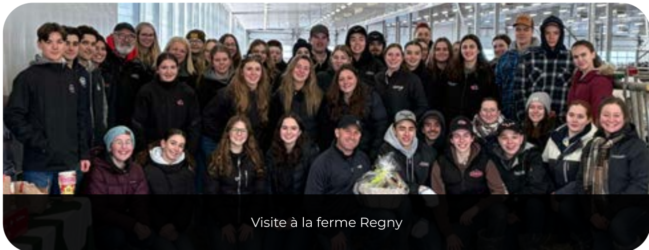
Visite à la ferme Regny