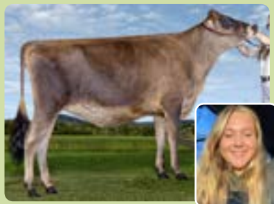
REJEBEL MOONLIGHT ELLY Annick Plourde, CJR Bas St-Laurent