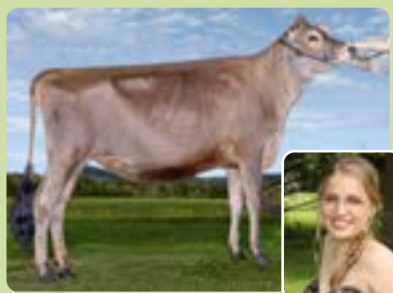
KAROBERT FRANKSTYLE VIP ELZA Sara-Maude Ruel, CJR Bassin-de-la-Chaudière