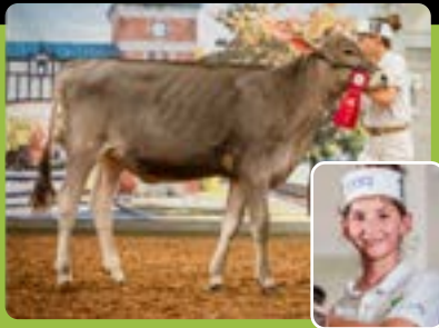
BROWNHEAVEN DESIGN FELICITY Alyson Rousseau, CJR Bagot-St-Hyacinthe