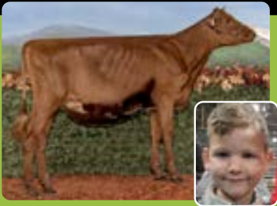
MARILIE AUTOGRAPH MONROE Émile Poirier, CJR Lévrard-Becquets