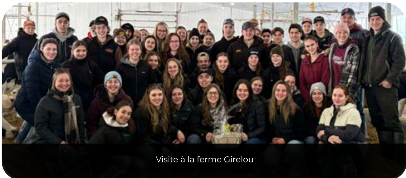
Visite à la ferme Girelou