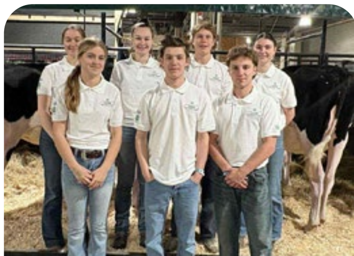
Jeunes Québec - Centre