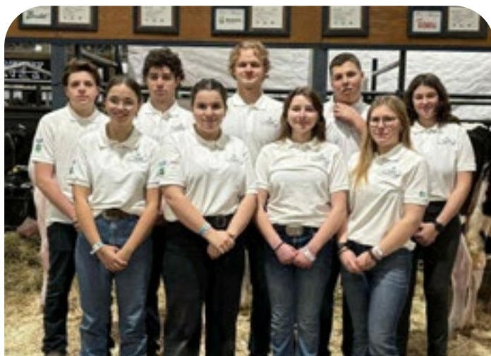
Jeunes Québec - Sud et Est