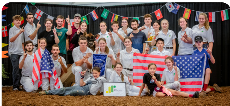
Championnat de conformation (ex aequo)