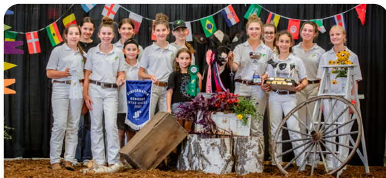
Championnat de conformation (ex aequo)