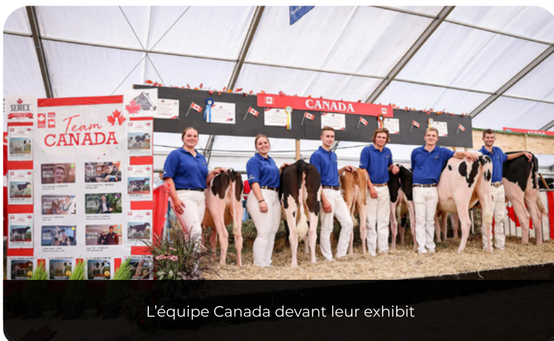
L'équipe Canada devant leur exhibit