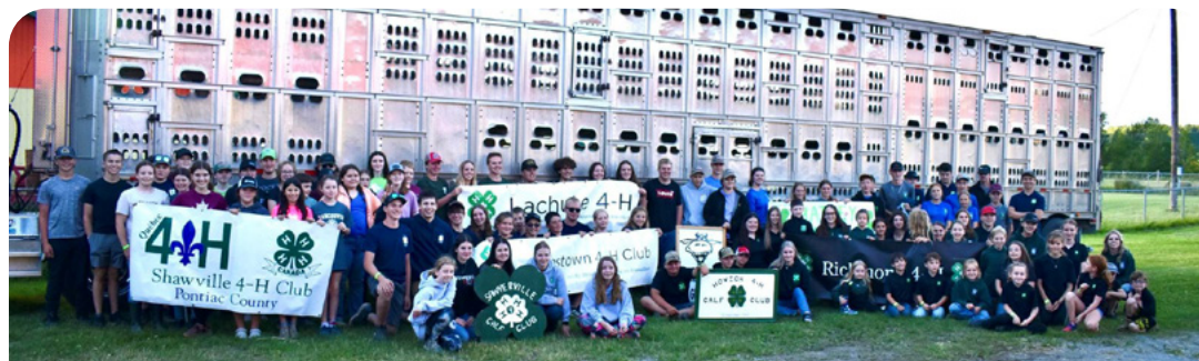
Les participants du Rallye provincial 2024.