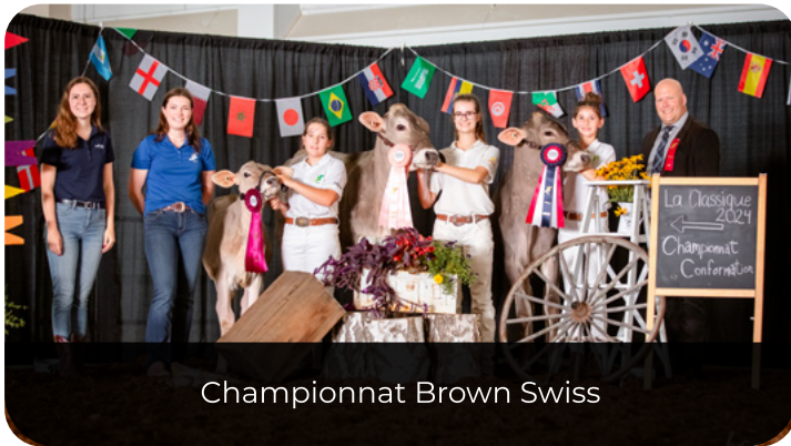
Championnat Brown Swiss