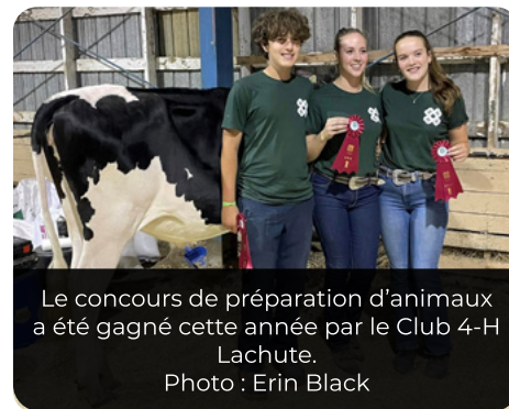
Le concours de préparation d'animaux a été gagné cette année par le Club 4-H Lachute.