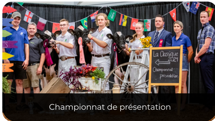
Championnat de présentation